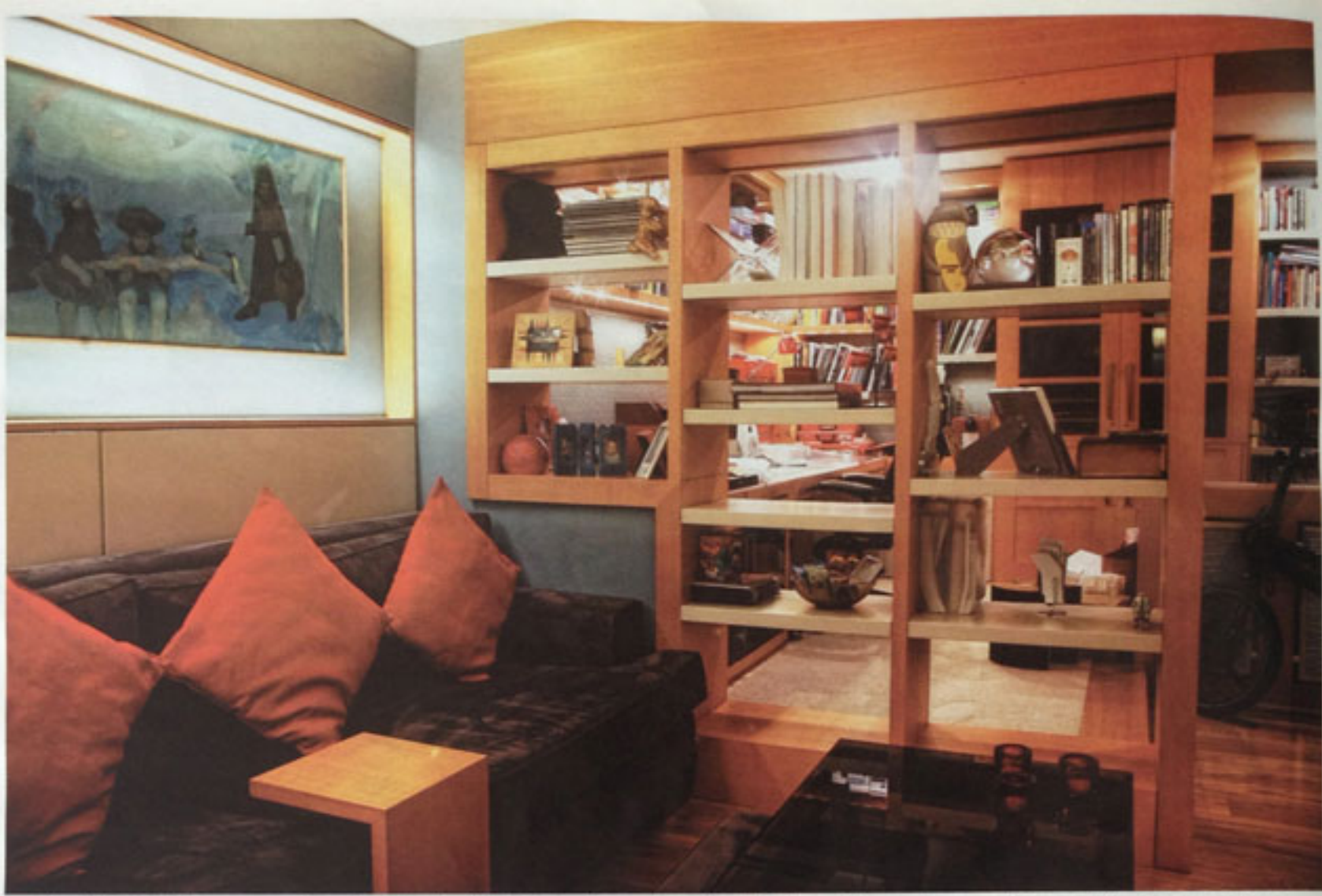
Aşağı katta bulunan yaşam alanı diye adlandırabileceğimiz çalışma odası çok renkli. Ahşap dekor ve kırmızı renk ile sıcak bir ortam yaratılmış. Dekorda kullanılan aksesuarlar yurtdışından özel olarak seçilmiş.